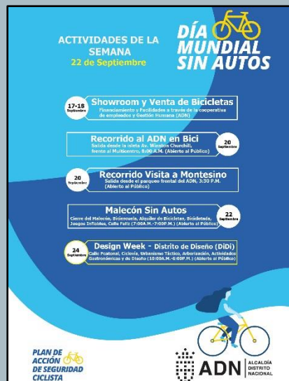
Imagen 1: Programa de actividades Semana Sin Autos

La agenda inicio el día 17 y se extendió al 24 de septiembre, la misma se dio a conocer como la Semana Sin Autos (Ver Imagen 1).