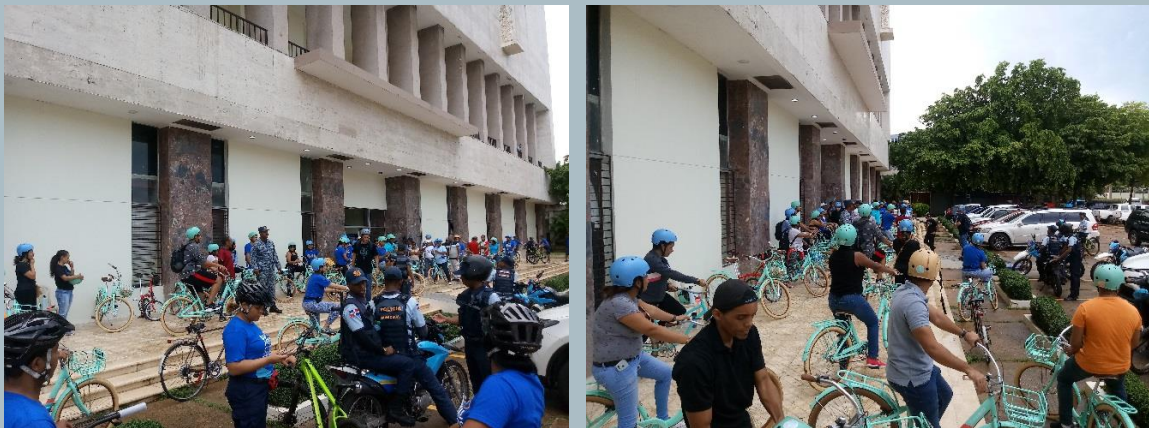
Fotos 3: Paseo en bicicleta al Monumento Fray Antonio de Montesino

-Paseo a Montesino: El segundo recorrido se realizó como un paseo en bicicleta saliendo desde las instalaciones de la alcaldía en La Feria y utilizando la ciclovía del Malecón para llegar hasta el monumento Fray Antonio de Montesino, finalizando nuevamente en el punto de partida. Este se realizó a las 4:00 pm de la tarde del mismo viernes 20, con un recorrido de aproximadamente 10 kilómetros y un total de 45 personas entre empleados del ADN y colaboradores. (Ver Fotos 3).